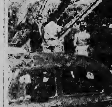
HOPÍ MORTO NA EXPLOSION DI DINAMET DEN MINA SURAFRICANO. — Na ocasion di un explosion di binti cahá di dinamiet na South Roodepoort na Johannesburg, a tuma lugar semana pasa Dia Viernes segun e ultimo noticianan, asesinato di 22 africano y 24 europeo. Expertonan ta considera cu e numero di mortonan par aumenta te 40.

LEOPOLDSTAD, 26 februari. — E trupanen lumumbista di Oostprovincia y e trupanen di gobierno central di Coronel Mobutu a reuni na Luluaburg, asina e portavoz di Nacionnan Uni a informa awe mainta na Leopoldstad. Luluaburg ta capital di estado autonomo Sur Kasai.